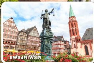
แฟรงค์เฟิร์ต