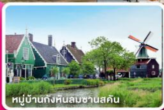
หมู่บ้านกังหันลมซานสคัน