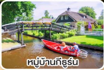
หมู่บ้านกังหัน