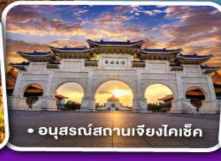
• อนุสรณ์สถานเจียงโคเช็ก