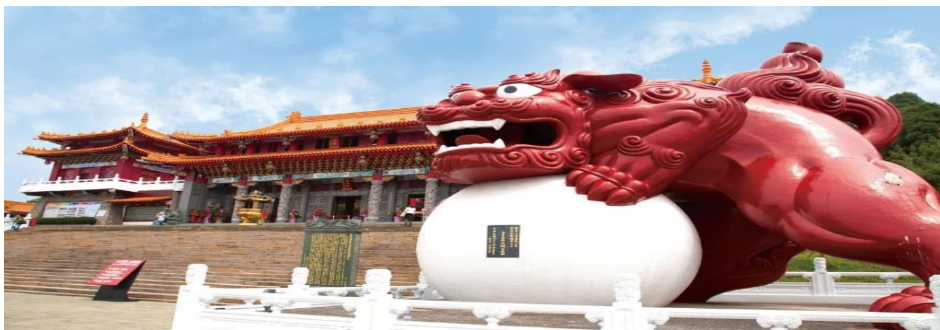
GO1CNXTPE-JX004 ไปแล้วกันเด้อะ บินตรง เชียงใหม่ ไต้หวัน เที่ยวบิน 3 อุทยาน 6 วัน 5 คืน STARLUX (JX)

นำท่านเดินทางสู่ วัดเหวินหวู่ Wenwu Temple หรือ วัดกวนอู ตั้งอยู่ระหว่างเขาทางทิศเหนือของทะเลสาบสุรียันจันทรา สร้างขึ้นเมื่อปี ค.ศ. 1938 เป็นวัดศักดิ์สิทธิ์อีกแห่งหนึ่งของไต้หวัน แต่เดิมในอดีตริมฝั่งทะเลสาบสุรียันจันทราเป็นที่ตั้งของ 2 วัดเก่า คือวัดหลงฟิงและวัดหัวถ้ง ต่อมาเมื่อญี่ปุ่นได้เข้ายึดครองเกาะไต้หวันและได้สร้างเขื่อนผลิตไฟฟ้าบริเวณทะเลสาบสุรียันจันทราในปีค.ศ. 1934 ส่งผลให้ระดับน้ำในทะเลสาบเพิ่มสูงขึ้นจนท่วมวัดเก่าทั้ง 2 แห่ง ทางญี่ปุ่นจึงได้จ่ายค่าชดเชยให้ทางการไต้หวันโดยการสร้างวัดแห่งใหม่ขึ้นบนไหล่เขาทางตอนเหนือของทะเลสาบแทนวัดเก่าทั้งสองที่เสียหายจากน้ำท่วมจึงเป็น วัดเหวินหวู่ ในปัจจุบัน สถาปัตยกรรมของวัดนี้เต็มไปด้วยงานแกะสลักหินจำนวนมากรวมถึงสิงโตหินอ่อน 2 ตัว ที่ตั้งอยู่บริเวณด้านหน้าของวัดซึ่งมีมูลค่าตัวละ 1 ล้านบาทโดยไต้หวันโดยตัววิหารใหญ่แบ่งออกเป็นสามชั้นและมีวิหารเล็กโอบล้อมอยู่ด้านข้าง