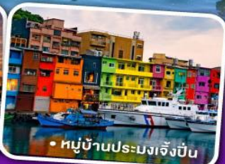
• หมู่บ้านประมงเจิ้งปิ่น