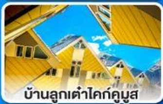
บ้านลูกเต่าโคกคูมุส