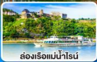
ล่องเรือแม่น้ำไรน์