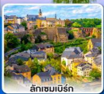
ลักเซมเบิร์ก

ล่องเรือ... ชมทัศนียภาพอันสวยงาม ตลอดสองฟากฝั่งของแม่น้ำไรน์