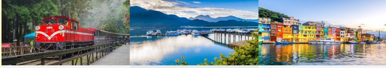
อุทยานแห่งชาติอาลีซาน ทะเลสาบสุริยันจันทรา ทำเรือประมงเจิ้งปิ่น

*ทางบริษัทฯ ขอสงวนสิทธิ์ในการสลับโปรแกรมทัวร์ตามความเหมาะสมขึ้นอยู่กับสถานการณ์หน้างาน โดยคำนึงถึงผลประโยชน์ของลูกค้าเป็นสำคัญ