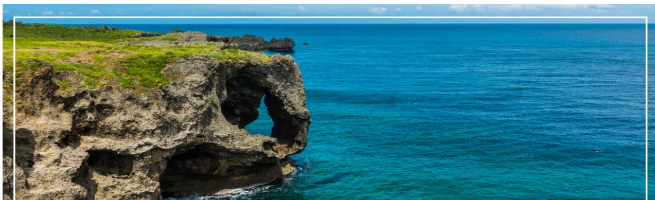
CAPE MANZAMO ฝามันซาโมะ

จากนั้นนำท่านเดินทางสู่ ฝามันซาโมะ (Cape Manzamo) (ใช้เวลาเดินทางประมาณ 1.20 ชั่วโมง) ฝามันซาโมะที่สูงชันกว่า 30 เมตรมีลักษณะคล้ายวงช้างหันหน้าสู่ทะเลจีน พื้นที่สีเขียวของต้นหญ้าที่ขึ้นปกคลุมจนถึงยอดหน้าผาดัดกับผืนน้ำทะเลสีฟ้าใส เป็นทิวทัศน์ที่สวยงามที่สุดแห่งหนึ่งในโอกินาวา ในวันที่ท้องฟ้าสดใสจะสามารถ มองเห็นความสวยงามของเกาะทางตอนเหนือและเกาะที่อยู่นอกชายฝั่ง