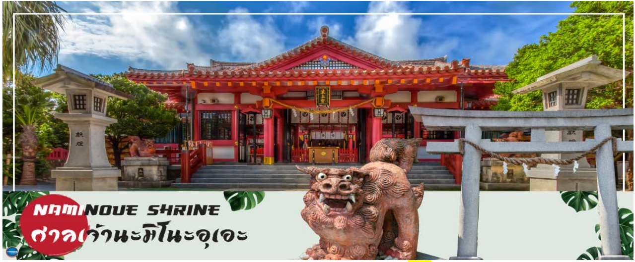
NAMINOUE SHRINE ศาลเจ้านะมิโนะอุเอะ

เช้า รับประทานอาหารเช้า ณ ห้องอาหารของโรงแรม (5) นำท่านเดินทางสู่ ศาลเจ้านามิโนะอุเอะ (Naminoue Shrine) (ใช้เวลาเดินทางประมาณ 10 นาที) ตั้งอยู่ ณ บริเวณที่เป็นพื้นที่ศักดิ์สิทธิ์ที่ใช้ในการสวดภาวนาอธิษฐานต่อเทพเจ้าที่สถิตย์อยู่ ณ อาณาจักรเจ้าสมุทรโพ้นทะเลมาแต่ครั้งโบราณ ในอดีตชาวเรือที่เข้าออก ณ ท่าเรือนาระะ (Naha Port) ซึ่งขณะนั้นเป็นศูนย์กลางการแลกเปลี่ยนค้าขายกับนานาประเทศ ทั้งจีน ประเทศทางตอนใต้ เกาหลี และชวยามาโดะ มักจะแหงนหน้ามองขึ้นไปยังศาลเจ้าซึ่งตั้งอยู่บนหน้าผาสูงเพื่ออธิษฐาน และแสดงความขอบคุณ ศาลเจ้านะมิโนะอุเอะได้รับความเสียหายจากการรบในโอกินาวะ (Battle of Okinawa) เมื่อครั้งสงครามแปซิฟิก แต่ได้รับการบูรณะฟื้นฟูในเวลาต่อมาเมื่อสงครามสิ้นสุดลง ปัจจุบันนี้ได้กลายเป็นศูนย์กลางแห่งศาสนาชินโตในจังหวัดโอกินาวะ ชาวญี่ปุ่นมักจะมาไหว้ขอพร เกี่ยวกับธุรกิจการงานให้เจริญรุ่งเรือง ร่ำรวย และมาสะเดาะเคราะห์ให้พ้นโชคร้าย จากนั้นนำท่านสู่ เอาท์เลตมอลล์ อาชิบิโน่า (Okinawa Outlet Mall Ashibinaa) (ใช้เวลาเดินทางประมาณ 30 นาที) เอาท์เลตแห่งแรกในโอกินาวะ รวบรวมร้านค้าชั้นนำกว่า 100 ร้าน ทั้ง เสื้อผ้าแฟชั่น สินค้าแบรนด์เนม นาฬิกา ข้าวของเครื่องใช้ ของเล่น ทุกร้านจัดเต็มทั้งสินค้านำเข้าและรุ่นใหม่ ลดราคากระหน่ำกว่า 30-80% ให้ได้ดินซ้อปิดท้ายทริปกันอย่างจุใจ ภายใต้บรรยากาศสบายๆ สไตล์รีสอร์ทริมทะเล หากช้อปปิ้งเหนื่อยสามารถขึ้นไปทานอาหารที่ชั้น 2 มีอีกหลายร้านที่คอยให้บริการ