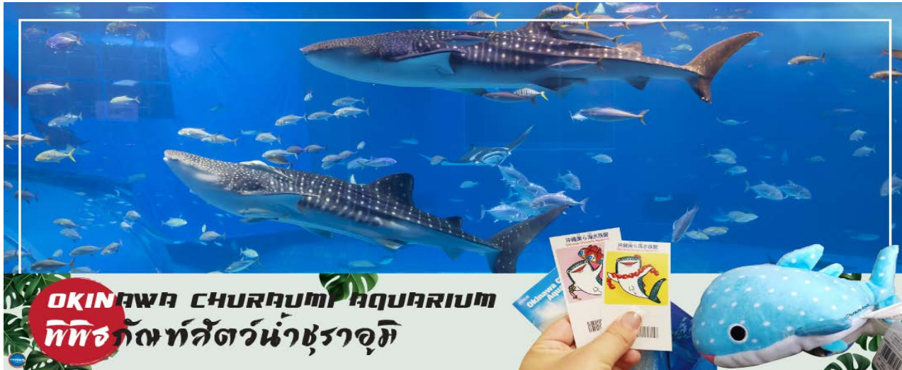
OKINAWA CHURAU MI AQUARIUM พิพิธภัณฑ์สัตว์น้ำชुरาอุมิ