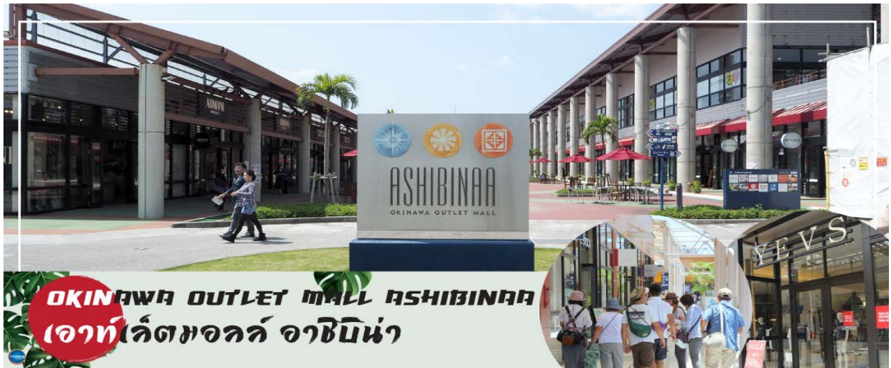
OKINAWA OUTLET MALL ASHIBINAA เอาท์เลตมอลล์ อาชิบิโน่า

เช้า รับประทานอาหารเช้า ณ ห้องอาหารของโรงแรม (5) นำท่านเดินทางสู่ ศาลเจ้านามิโนะอุเอะ (Naminoue Shrine) (ใช้เวลาเดินทางประมาณ 10 นาที) ตั้งอยู่ ณ บริเวณที่เป็นพื้นที่ศักดิ์สิทธิ์ที่ใช้ในการสวดภาวนาอธิษฐานต่อเทพเจ้าที่สถิตย์อยู่ ณ อาณาจักรเจ้าสมุทรโพ้นทะเลมาแต่ครั้งโบราณ ในอดีตชาวเรือที่เข้าออก ณ ท่าเรือนาระะ (Naha Port) ซึ่งขณะนั้นเป็นศูนย์กลางการแลกเปลี่ยนค้าขายกับนานาประเทศ ทั้งจีน ประเทศทางตอนใต้ เกาหลี และชวยามาโดะ มักจะแหงนหน้ามองขึ้นไปยังศาลเจ้าซึ่งตั้งอยู่บนหน้าผาสูงเพื่ออธิษฐาน และแสดงความขอบคุณ ศาลเจ้านะมิโนะอุเอะได้รับความเสียหายจากการรบในโอกินาวะ (Battle of Okinawa) เมื่อครั้งสงครามแปซิฟิก แต่ได้รับการบูรณะฟื้นฟูในเวลาต่อมาเมื่อสงครามสิ้นสุดลง ปัจจุบันนี้ได้กลายเป็นศูนย์กลางแห่งศาสนาชินโตในจังหวัดโอกินาวะ ชาวญี่ปุ่นมักจะมาไหว้ขอพร เกี่ยวกับธุรกิจการงานให้เจริญรุ่งเรือง ร่ำรวย และมาสะเดาะเคราะห์ให้พ้นโชคร้าย จากนั้นนำท่านสู่ เอาท์เลตมอลล์ อาชิบิโน่า (Okinawa Outlet Mall Ashibinaa) (ใช้เวลาเดินทางประมาณ 30 นาที) เอาท์เลตแห่งแรกในโอกินาวะ รวบรวมร้านค้าชั้นนำกว่า 100 ร้าน ทั้ง เสื้อผ้าแฟชั่น สินค้าแบรนด์เนม นาฬิกา ข้าวของเครื่องใช้ ของเล่น ทุกร้านจัดเต็มทั้งสินค้านำเข้าและรุ่นใหม่ ลดราคากระหน่ำกว่า 30-80% ให้ได้ดินซ้อปิดท้ายทริปกันอย่างจุใจ ภายใต้บรรยากาศสบายๆ สไตล์รีสอร์ทริมทะเล หากช้อปปิ้งเหนื่อยสามารถขึ้นไปทานอาหารที่ชั้น 2 มีอีกหลายร้านที่คอยให้บริการ