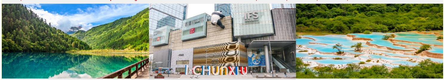
อุทยานฯจิวอ้ายโก