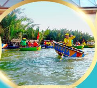
ล่องเรือกระดังง์