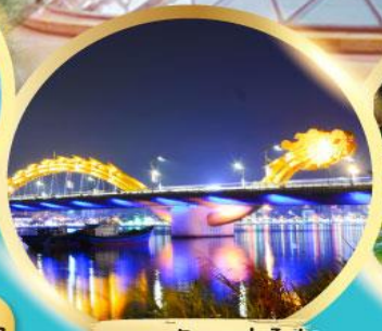
สะพานมังกรพันไฟ