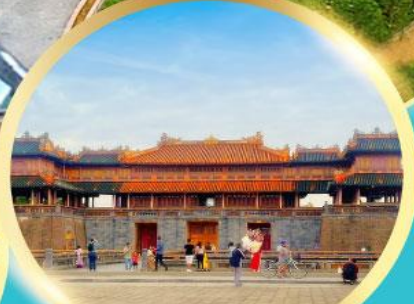
พระราชวังโบราณไดโนย

เมนูพิเศษ ! กุ้งมังกรซอสเสวย + หม้อไฟ ทะเล SEAFOOD 1 มื้อ, บิงย่าง ซาบู 1 มื้อ