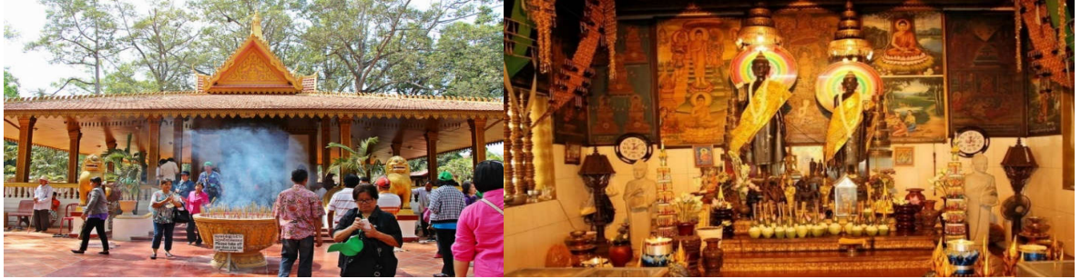
เมืองเสียมเรียบ

ไหว้เพื่อขอความสุข ความเจริญ และความสำเร็จ ชม พระราชตำหนักหลวง ที่สร้างขึ้นตั้งแต่ยุคของพระเจ้าบรมมสืหนุ สำหรับเป็นที่พำนักของพระองค์ เมื่อเสด็จมา