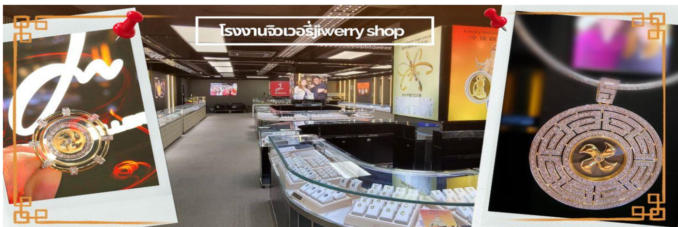
โรงงานจิวเวลรี่ jewelry shop

วันตรุษจีน ซึ่งพิธีนี้ใน 1 ปี มีเพียงครั้งเดียวเท่านั้นจากนั้น จากนั้นนำท่านชม โรงงานจิวเวลรี่ ซึ่งเป็นโรงงานที่มีชื่อเสียงที่สุดของฮ่องกงในเรื่องการออกแบบเครื่องประดับ อาทิเช่น จี้ และแหวนกำหั้น ที่สวยงามโดดเด่นไม่เหมือนใคร ซึ่งถือกำเนิดขึ้นที่นี่และมีชื่อเสียงที่สุดใช้เป็นเครื่องประดับติดตัว และเสริมดวงชะตา สินค้าทุกชิ้นมีเอกสารรับประกันคุณภาพเปลี่ยน ซ่อม ใต้ตลอดอายุการใช้งาน หากเกิดการชำรุดจากสินค้าไม่ใช่อุบัติเหตุ และนำท่านเลือกซื้อ เครื่องประดับที่ ร้านหยก ซึ่งคนจีนนั้นถือว่าหยกเป็นหิน ที่เป็นตัวแทนของความสวยงามและความบริสุทธิ์ มีความเชื่อว่าหยกมงคล ถ้าพกติดตัวไว้จะอายุยืนและสุขภาพดี