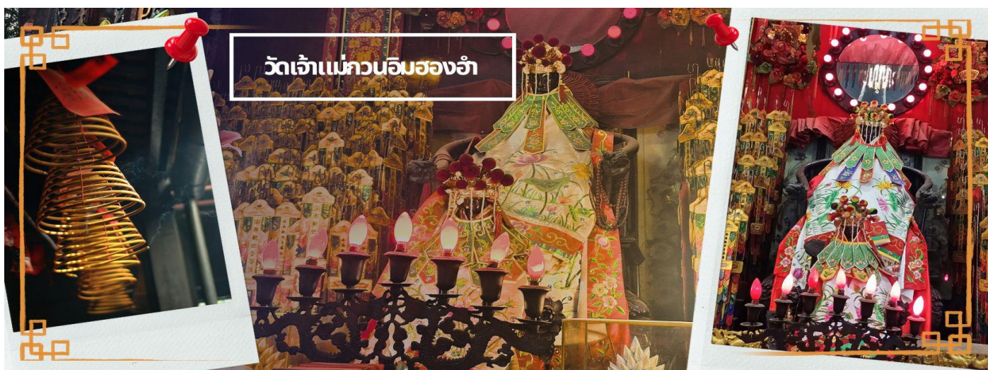
วัดเจ้าแม่กวนอิมสองฮา

จากนั้นนำทุกท่านเดินทางสู่ วัดเจ้าแม่กวนอิมสองฮา (HUNG HOM KWUN YUM TEMPLE) เป็นหนึ่งในวัดที่ชาวฮ่องกงนั้นเลื่อมใสกันมาก ด้วยความที่เจ้าแม่กวนอิมนั้นเป็นเทพเจ้าแห่งความเมตตา ฉะนั้นเมื่อใครมีทุกข์ร้อนอะไรก็มักจะมาราบไหว้ขอพรให้เจ้าแม่ช่วยเหลือ วัดนี้ถูกสร้างขึ้นในปี ค.ศ. 1873 ในช่วงสงครามโลกครั้งที่ 2 มีการปล่อยระเบิดลงบริเวณวัดสองฮาหลายต่อหลายครั้ง ทำให้มีผู้บาดเจ็บและล้มตายมากมาย แต่ชาวบ้านที่หนีเข้าไปหลบภัยในวัดนี้ก็ปลอดภัยและตัววัดก็ไม่ได้รับความเสียหายจากเหตุการณ์ทั้งระเบิดอย่างน่าอัศจรรย์ และวันสำคัญอีกวันหนึ่งที่คนหลังไหลมาไหว้ขอพรอย่างไม่ขาดสาย และรอยคยเป็นประจำทุกปี ก็คือ "วันเปิดทรัพย์" หรือ วันยืมเงินเทพเจ้า เป็นวันที่จะมาขอพรและยืมเงินเจ้าแม่กวนอิม ซึ่งตรงกับวันที่ 26 นับจาก