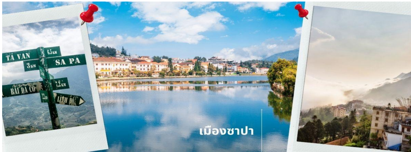
เมืองซาปา

14.20 น. เดินทางถึง สนามบินसानอย หลังผ่านการตรวจคนเข้าเมืองและศุลกากรแล้วนำท่านขึ้นรถบัสปรับอากาศ นำท่านเดินทางขึ้นเหนือมุ่งหน้าสู่ เมืองซาปา ซึ่งตั้งอยู่ทางภาคเหนือของประเทศเวียดนามใกล้กับชายแดนจีน อยู่ในเขตจังหวัดลาวไก ตัวเมืองตั้งอยู่บนระดับความสูงกว่าระดับน้ำทะเลถึง 1,650 เมตร จึงมีอากาศหนาวเย็นตลอดปี ที่นี่จึงเป็นแหล่งปลูกผักและผลไม้เมืองหนาวที่สำคัญของเวียดนาม อีกทั้งยังเป็นดินแดน