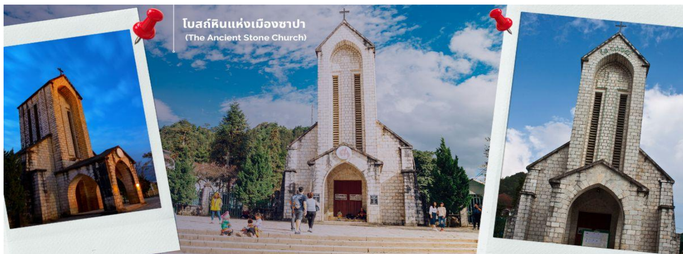
โบสถ์หินแห่งเมืองซาปา (The Ancient Stone Church)

นำท่านช้อปปิ้งที่ ตลาดไนท์เมืองซาปา มีสินค้าให้ท่านเลือกช้อปปิ้งมากมาย ไม่ว่าจะเป็นสินค้าพื้นเมืองของฝาก ขนม กระเป๋า รองเท้า ท่านสามารถช้อปปิ้งได้อย่างจุใจ