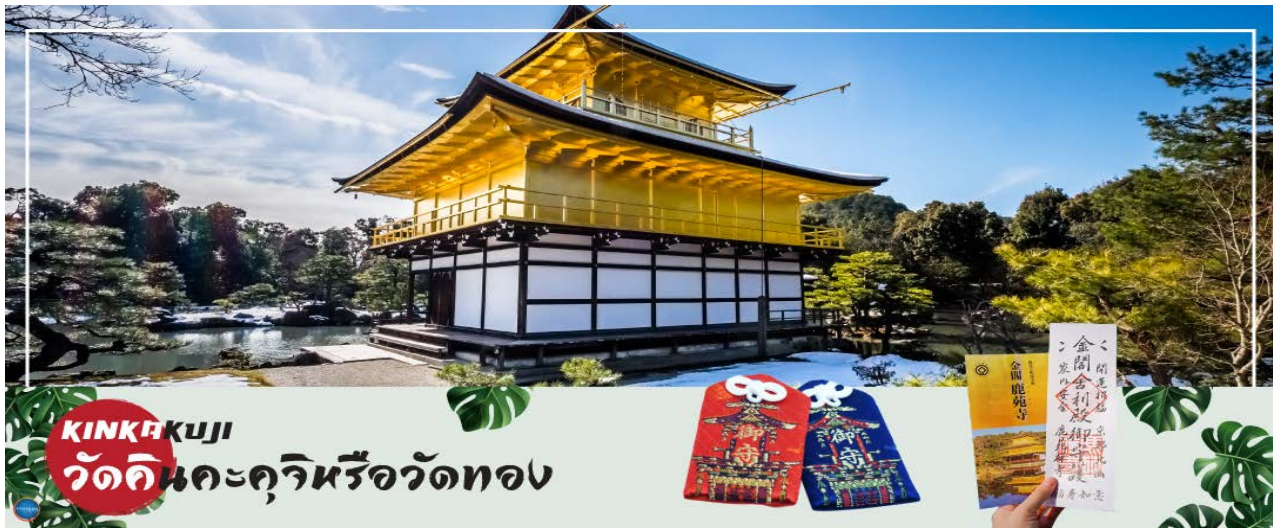
KINKAKUJI วัดคินคะคุจิหรือวัดทอง

เที่ยง รับประทานอาหารกลางวัน ณ ภัตตาคาร (6)