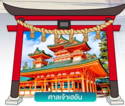
ศาลเจ้าเออนิ