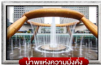
น้ำพุแห่งความมั่งคั่ง