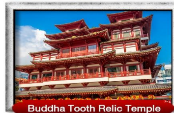
Buddha Tooth Relic Temple