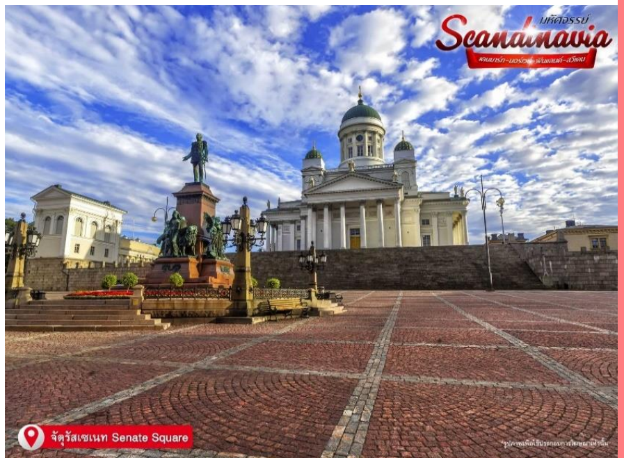
จตุรัสเซเนท Senate Square

คลาสสิกสมัยศตวรรษที่ 19 ด้านหน้าโบสถ์มีรูปปั้นพระเจ้าอเล็กซานเดอร์ที่ 2 ที่บริเวณนั้น หอสมุดแห่งชาติเฮลซิงกิ (Helsinki Central library) หน้าอาคารภายนอกสีเหลือง เสาสีขาวและโถงกลมตรงกลาง ในมุมตะวันออกเฉียงใต้ของจตุรัสคือบ้านของเซเดร์โฮล์ม ซึ่งเป็นอาคารหินที่เก่าแก่ที่สุดของเมือง