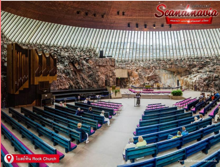
โบสถ์หิน Rock Church

โบสถ์เทมเปลิโอคิโอ หรือ โบสถ์หิน (Rock Church) เป็น โบสถ์ ที่มีสถาปัตยกรรมแปลกกว่าที่อื่น โดยแต่เดิมพื้นที่ของโบสถ์นี้เป็นเนินเขา และผู้ออกแบบได้ใช้วิธีสร้างโบสถ์ที่น่าสนใจ คือระเบิดเนินหินตรงกลางเพื่อสร้าง โบสถ์ในนั้น โบสถ์ที่ได้ขึ้นชื่อว่าเป็น โบสถ์แห่งความรัก และมีความเชื่อว่าเมื่อใครก็ตามจุดเทียน อธิฐานเรื่องเกี่ยวกับความรักในโบสถ์นี้แล้วจะสมหวังในสิ่งที่อธิษฐาน คนฟินแลนด์มีความเชื่อเรื่องนี้ เนื่องจากโบสถ์นี้สร้างขึ้นเมื่อวันที่ 14 กุมภาพันธ์ 2511 และเสร็จเมื่อวันที่ 14 กุมภาพันธ์ของปีถัดไป เดินทางสู่ จตุรัสเซเนท (Senate