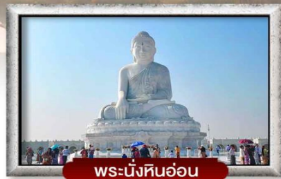
พระนั่งหินอ่อน