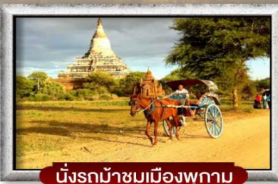
นั่งรถม้าชมเมืองพุกาม