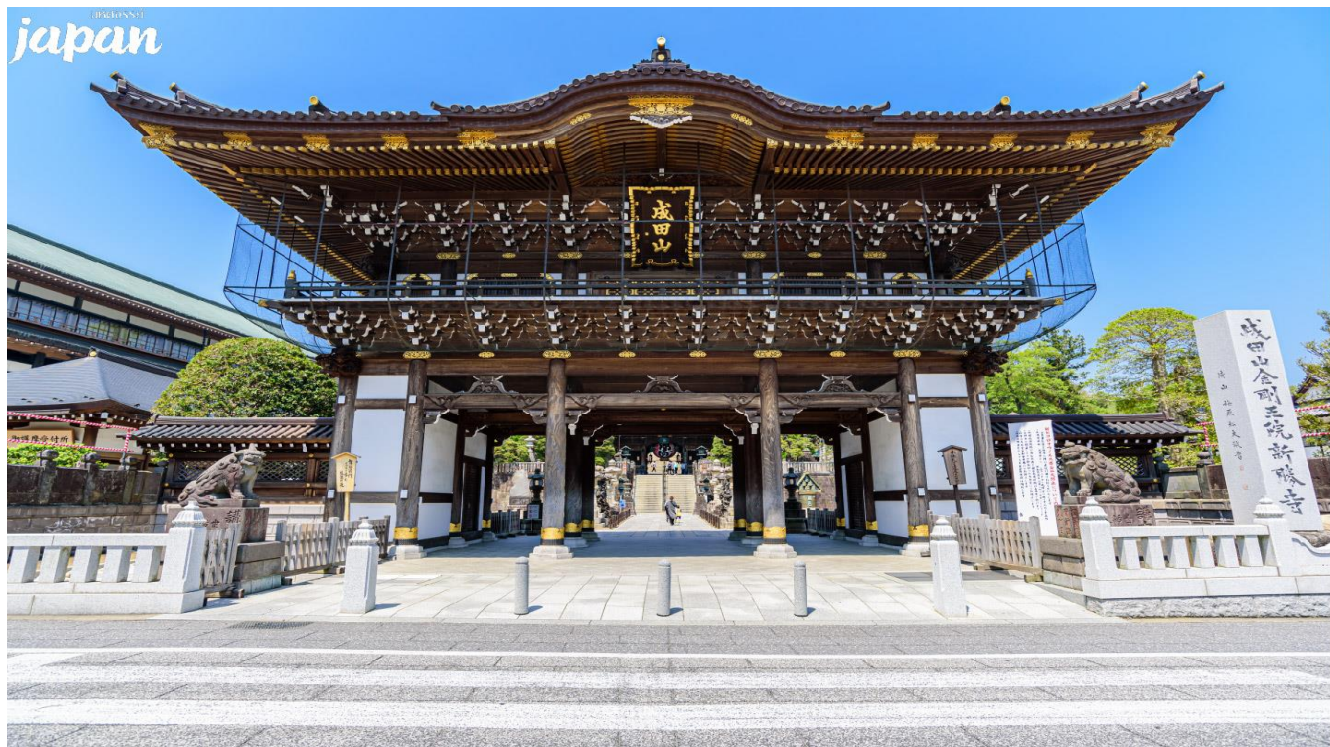
นพคจยย...JAPAN พุจิ นาริตะ คาวาโกเอะ - หน้า 5 -

วัดนาริตะซันชินโซจิ ถูกตั้งขึ้นเมื่อ ค.ศ.940 เป็นวัดในพระพุทธศาสนาที่ตั้งอยู่ในเมืองนาริตะ จังหวัดชิบะที่วัดแห่งนี้มีรูปเคารพขององค์ฟูโดเมียวโอะ ที่มีชื่อเรียกขานกันมาตั้งแต่สมัยโบราณว่า "นาริตะฟูโด" ประดิษฐานเป็นองค์พระประธาน ถือเป็นหนึ่งในศาสนสถานสำคัญที่เป็นศูนย์กลางความศรัทธาต่อองค์ฟูโดเมียวโอะ