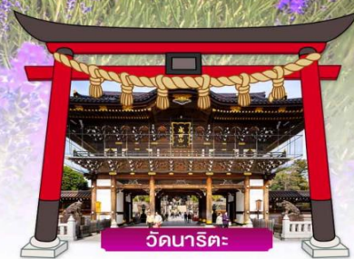
วัดนาริตะ