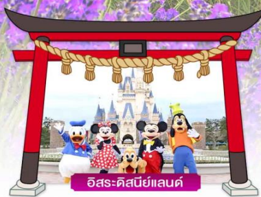
อิสระคิสนีย์แลนด์