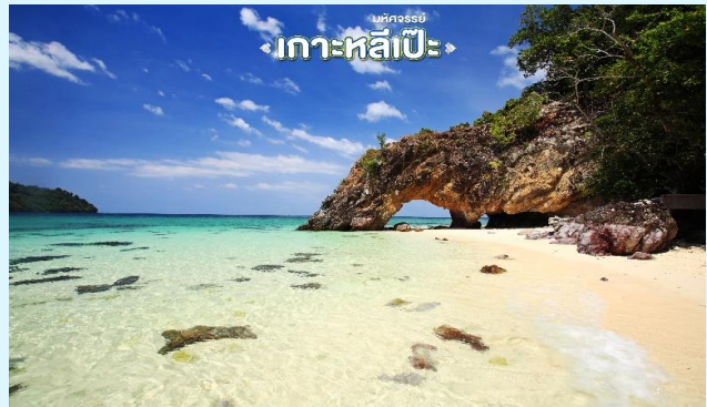
มหัทจรรย์..เกาะหลีเป๊ะ ทะเลสุดปัง ดำน้ำดูที่สวยของปะการังเมืองไทย - หน้า 2 -

จากนั้น แวะชม เกาะไข เกาะเล็กๆ ในอุทยานแห่งชาติตะรุเตา เส้นโค้งของเกาะไขอยู่ตรงประติมากรรมธรรมชาติอย่างข้มประตูลิ้นอันเป็นสัญลักษณ์ของอุทยานแห่งชาติตะรุเตา ทางด้านทิศตะวันตกของเกาะมีหาดทรายสีขาวนวลและละเอียด น้ำทะเลใสสีมรกตเห็น