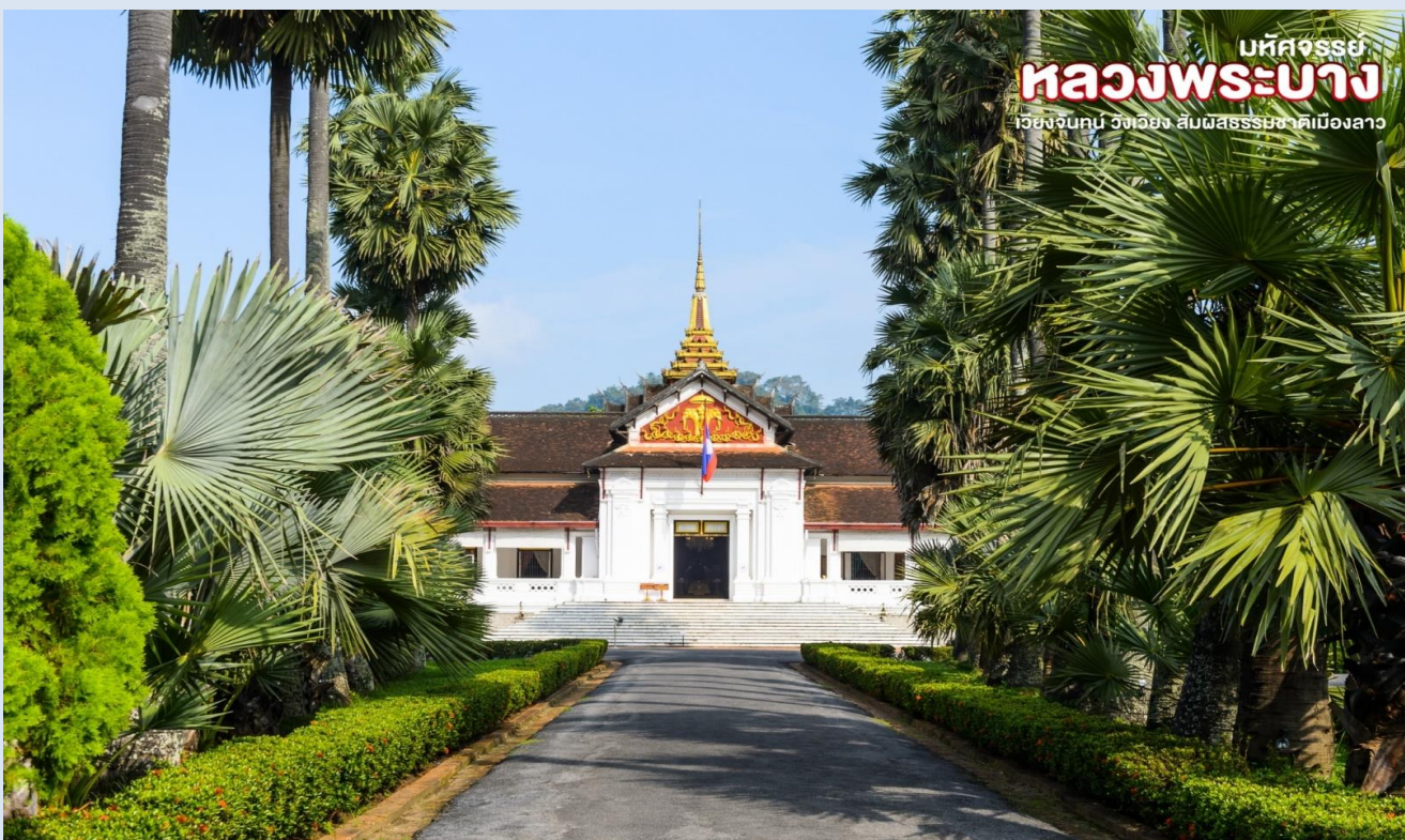
มหัสจรรย์ หลวงพระบาง เที่ยงจันทน์ วังเวียง สัมผัสธรรมชาติเมืองลาว

นำท่านชม พระราชวังเก่า (Royal Palace Museum) เป็นวังที่เจ้ามหาชีวิตศรีสว่างวงศ์ ทรงประทับอยู่ที่นี่จนสิ้นพระชนม์ เมื่อมีการเปลี่ยนแปลงการปกครองเมื่อปี พ.ศ.2518 พระราชวังก็ได้ถูกเปลี่ยนเป็นพิพิธภัณฑสถาน ประกอบด้วยหอพิพิธภัณฑ์ห้องรับแขกของเจ้ามหาชีวิตและพระมเหสี ห้องทองพระโรงทางด้านหลังก็เป็นพระตำหนักซึ่งมีเครื่องใช้ไม้สอยต่างๆ จัดเก็บไว้เป็นระเบียบเรียบร้อย