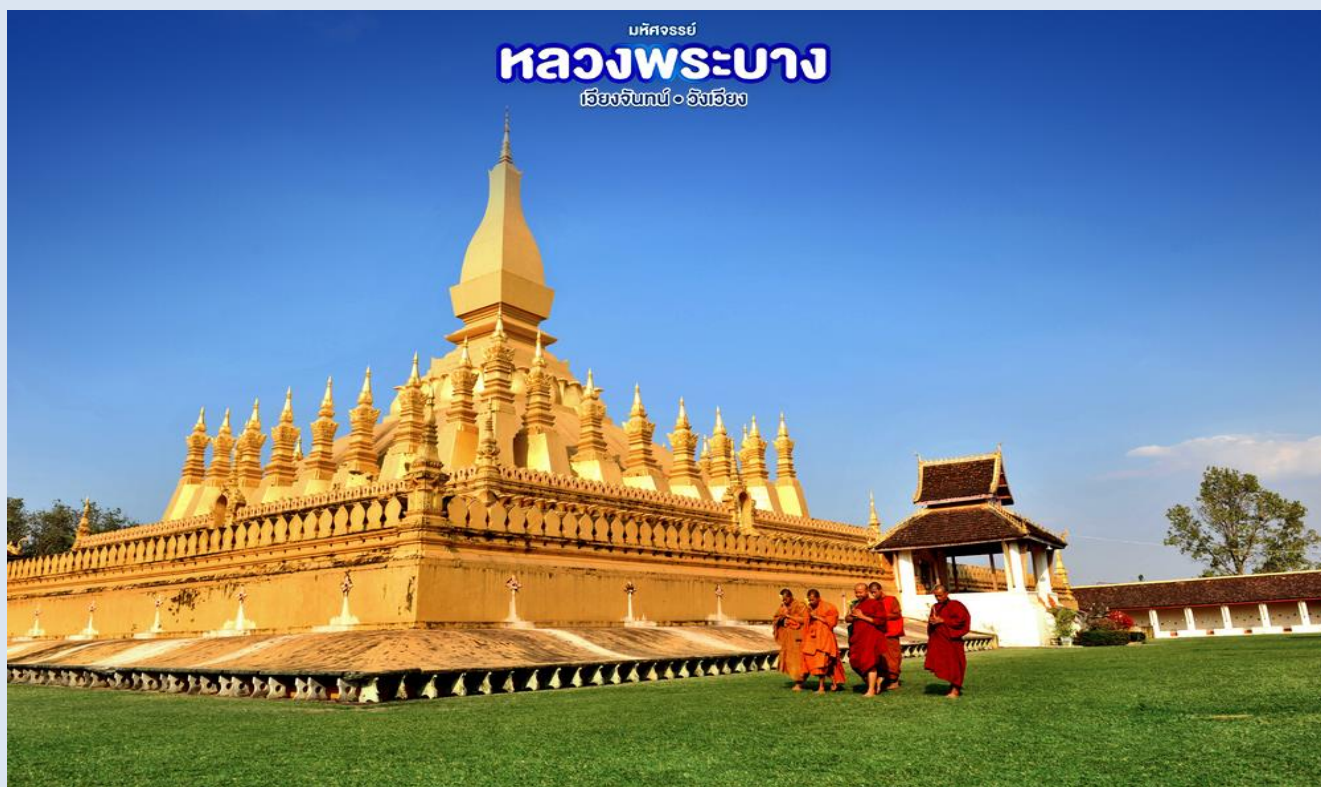
มหัศจรรย์ หลวงพระบาง เวียงจันทน์ • อังโฮม

จากนั้น เดินทางสู่เวียงจันทน์ นำท่านสักการะ วัดพระธาตุหลวง(THATLUANG PAGODA) เป็นเจดีย์ที่มีลักษณะโดดเด่นที่สุดในอาณาจักรล้านช้างเป็นการผสมผสานระหว่างสถาปัตยกรรมในพระพุทธศาสนากับสถาปัตยกรรมของอาณาจักรมีลักษณะคล้ายป้อมปราการมีการก่อสร้างระเบียงสูงใหญ่ขึ้นโอบล้อมองค์พระธาตุไว้พร้อมกับทำช่องหน้าต่างเล็กๆเอาไว้โดยตลอด ประตูทางเข้าเป็นบานประตูไม้ใหญ่ลวดลายประณีตพระธาตุยังมีเจดีย์บริวารล้อมอยู่โดยรอบ