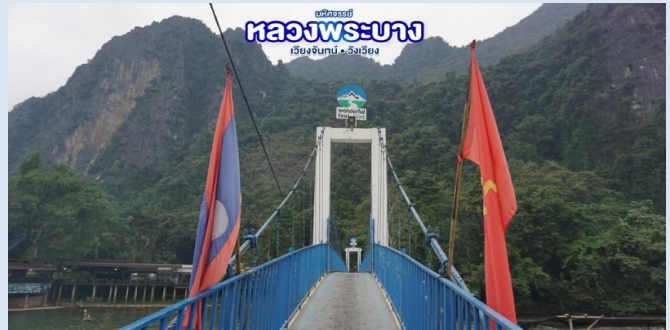
มหิศจรรย์..หลวงพระบาง สัมผัสธรรมชาติเมืองลาว - หน้า 9 -

เที่ยง จากนั้น บริการอาหารกลางวัน ณ ร้านอาหาร นำท่านชม ถ้ำนางฟ้า ถ้ำที่มีหินงอกหินย้อยสวยงามมากมาย และยังเป็นสถานที่ท่องเที่ยวใหม่ของวังเวียง เป็นอีกหนึ่งจุดท่องเที่ยวธรรมชาติของวังเวียงที่ควรต้องไปชม ถ้ำหินงอกหินย้อยที่สวยงาม ก่อนขึ้นถ้ำจะต้องเดินผ่าน สะพานแขวนสีฟ้า ที่ทอดข้ามผ่านแม่น้ำเป็นอีกจุดไฮไลท์ที่ต้องมาเช็คอิน