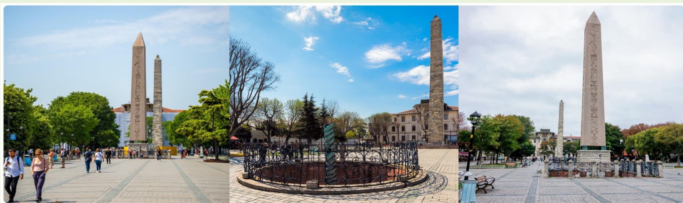
หน้า 13 (ภาพใช้เพื่อการโฆษณาเท่านั้น)

จากนั้นนำทุกท่านสู่ จัตุรัสสุลต่านอะห์เมตหรือฮิปโปโดรม (HIPPODROME) สนามแข่งม้าของชาวโรมัน จุดศูนย์กลางแห่งการท่องเที่ยวเมืองเก่า สร้างขึ้นในสมัยจักรพรรดิ เซปติมิอุสเซเวรุสเพื่อใช้เป็นเวทีแสดงกิจกรรมต่างๆของชาวเมือง ต่อมาในสมัยของจักรพรรดิคอนสแตนตินฮิปโปโดรมได้รับการขยายให้กว้างขึ้นตรงกลางเป็นที่ตั้งแสดงประติมากรรมต่าง ๆซึ่งส่วนใหญ่เป็นศิลปะในยุคกรีกโบราณในสมัยออตโตมันสถานที่แห่งนี้ใช้เป็นที่จัดงานพิธีแต่ในปัจจุบันเหลือเพียงพื้นที่ลานด้านหน้ามัสยิดสุลต่านอะห์เมตซึ่งเป็นที่ตั้งของเสาโอเบลิสก์ 3 ต้น คือเสาที่สร้างในอียิปต์เพื่อถวายแก่ฟาโรห์ทุตโมซิสที่ 3 ถูกนำกลับมาไว้ที่อิสตันบูลเสาต้นที่สอง คือเสาสูง และเสาต้นที่สาม คือเสาคอนสแตนตินที่ 7