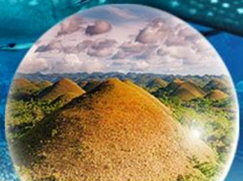
CHOCOLATE HILLS เกาะโมโฮล