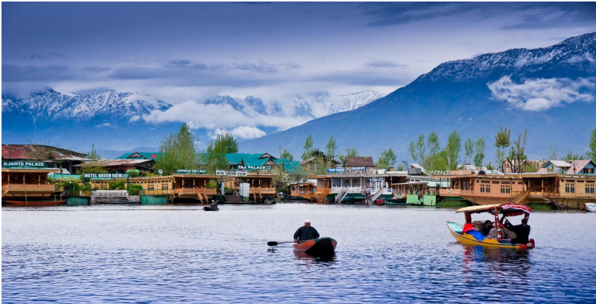
ล้อมโดยรอบ ในสมัยที่ถูกปกครองโดยราชวงศ์โมกุล มีการจัดทำผังเมืองขึ้นมาใหม่ จึงทำให้แคชเมียร์เป็น

DAY 2 สนามบินเดลี – สนามบินศรีนาคา – แคชเมียร์ – กุลมาร์ค – นั่งกระเช้าลอยฟ้า – ชมทิวทัศน์เทือกเขากุลมาร์ค – ศรีนาคา – ล่องเรือชิคาร่า – ทะเลสาบดาล (B/L/D) เช้า บริการอาหาร ณ ห้องอาหารของโรงแรม 07.40 ออกเดินทางสู่ ท่าอากาศยานศรีนาคา เมืองแคชเมียร์ ประเทศอินเดีย โดยสายการบิน INDIGO เที่ยวบินที่ 6E 5201 09.10 เดินทางถึง ท่าอากาศยานศรีนาคา รัฐแคชเมียร์ ประเทศอินเดีย หลังผ่านขั้นตอนการตรวจหนังสือเดินทาง และตรวจรับสัมภาระเรียบร้อยแล้ว นำท่านสู่ตัว เมืองศรีนาคา (SRINAGAR) ซึ่งเป็นเมืองหลวงของแคชเมียร์ ประกอบด้วยทะเลสาบขนาดใหญ่ คือ ทะเลสาบดาล และ ทะเลสาบนากิน ด้านหลังมีเทือกเขาโอบล้อมโดยรอบ