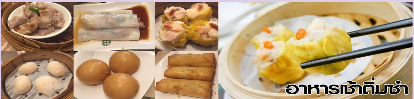
อาหารเช้าติ่มซำ

OPTIONAL : ค่าเพิ่มจากค่าทัวร์ ราคาตัวขึ้นอยู่กับวันที่ท่านเดินทางเช้าสวนสนุก เที่ยวสวนสนุกระดับโลก Disneyland (ไม่รวมค่าบัตรเข้าและรถรับส่ง เทียวละ 50HKD เดินทางขึ้นต่ำ 10 ท่าน) หรือมีตัวเองอิสระตามอัธยาศัย