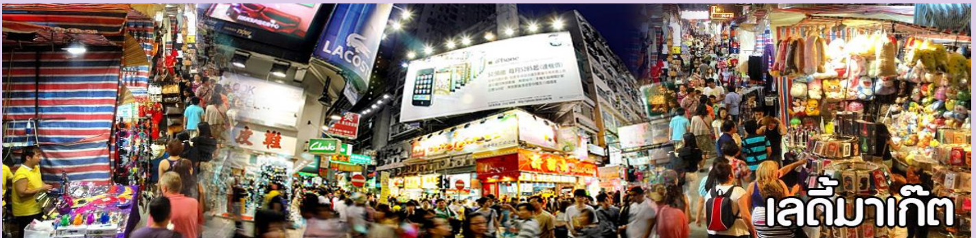
เลดี้มาร์เก็ต

อิสระอาหารค่ำตามอัธยาศัย เพื่อให้ทุกท่านสะดวกต่อการช้อปปิ้ง