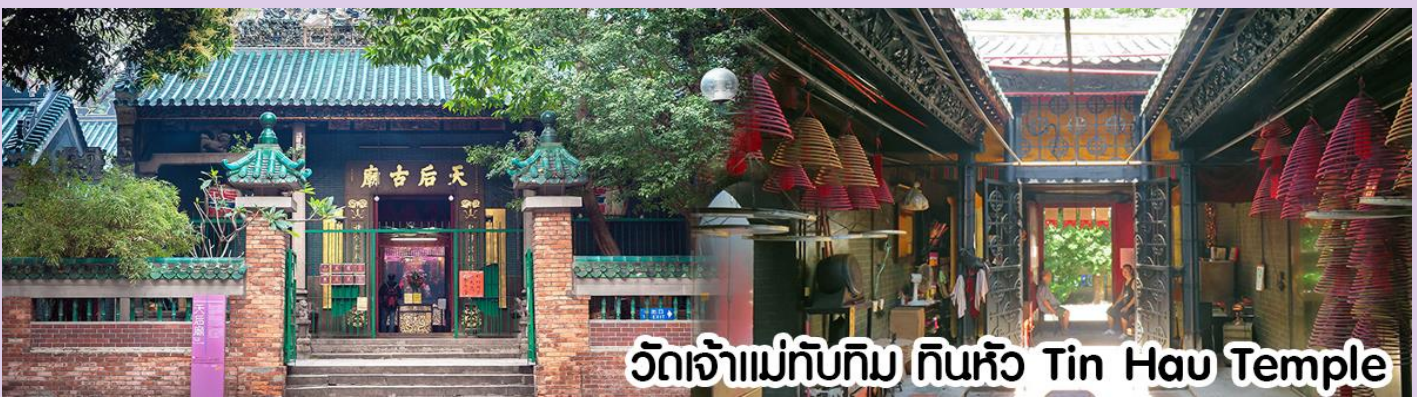
วัดเจ้าแม่ทับทิม ทินหัว Tin Hau Temple

นำทุกท่าน ไหว้ศาลเจ้าแม่ทับทิม ทินหัว (Tin Hau Temple) เป็นวัดเก่าแก่และสำคัญอีกวัดหนึ่งของฮ่องกง เพราะในสมัยก่อน ฮ่องกงเป็นเพียงหมู่บ้านชาวประมง ซึ่งเคารพนักถือเจ้าแม่ทับทิมว่าเป็นเทพีแห่งท้องทะเล เพื่อให้เดินทางปลอดภัย เวลาออกไปทำงานไกลๆ หรือออกหาปลา นอกจากการมาสักการะบูชาเจ้าแม่ทับทิมในเรื่องของการเดินทางให้ปลอดภัยแล้ว ไฮไลท์สำคัญอีกอย่างหนึ่งของวัดเจ้าแม่ทับทิม ทินหัว (Tin Hau Temple) จะเป็นชุดรูปปั้นขนาดใหญ่ ที่แขวนอยู่ตามเพดานด้านในของวัดก็จะเป็นสถาปัตยกรรมแบบวัดจีน สร้างขึ้นตั้งแต่ปี ค.ศ. 1876 โดยทางเข้าของวัดจะอยู่ติดกับสวนสาธารณะเล็ก ๆ ที่มีต้นไม้ใหญ่หลายต้น ให้บรรยากาศร่มรื่น