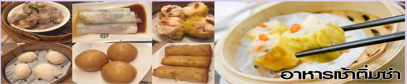
อาหารเช้าต้มซ่า

นำท่านไปไหว้ เจ้าแม่กวนอิมสงฮำ (Kun Im Temple Hung Hom) เป็นวัดเจ้าแม่กวนอิมที่มีชื่อเสียงแห่งหนึ่งในฮ่องกง ขอพรเจ้าแม่กวนอิมพระโพธิสัตว์แห่งความเมตตา ช่วยคุ้มครองและปกป้องรักษาวัดเจ้าแม่กวนอิมที่ Hung Hom หรือ “Hung Hom Kwun Yum Temple” เป็นวัดเก่าแก่ของฮ่องกงสร้างตั้งแต่ปี ค.ศ. 1873 ถึงแม้จะเป็นวัดขนาดเล็กที่ไม่ได้สวยงามมากมาย แต่เป็นวัดเจ้าแม่กวนอิมที่ชาวฮ่องกงนับถือมาก แทบทุกวันจะมีคนมาบูชาขอพรกันแน่นวัด ถ้าใครที่ชอบเสียงเชิมนซีเซาบอกว่าที่นี่แมนมากที่พิเศษกว่านั้น นอกจากสักการะขอพรแล้วยังมีพิธีขอของอั้งเปาจากเจ้าแม่กวนอิมอีกด้วย ซึ่งคนส่วนใหญ่จะนิยมไปโบสถ์กาลตรุษจีนเพราะเป็นตรุษจีนปีใหม่ ซึ่งทางวัดจะจำหน่ายอุปกรณ์สำหรับเช่นไหว้พร้อมของแดงไว้ให้ผู้มาขอพร เมื่อสักการะขอพรโชคลากแล้วก็นำของแดงมาวนเหนือกระถางรูปหน้าองค์เจ้าแม่กวนอิมตามเข็มนาฬิกา 3 รอบ และเก็บของแดงนั้นไว้ซึ่งภายในของจะมีจำนวนเงินที่ทางวัดจะเขียนไว้มากน้อยแล้วแต่โชค ถ้าหากเราประสบความสำเร็จเมื่อมี