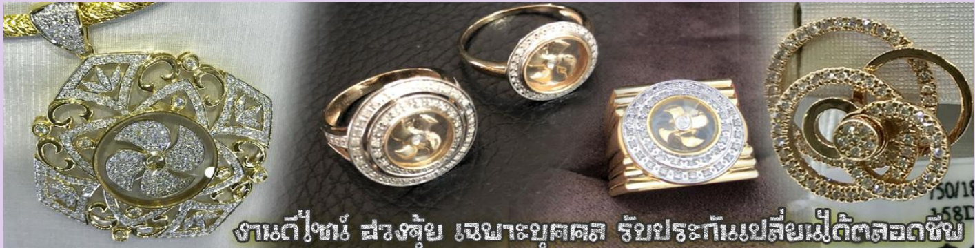
งานตีเพชร สรงจุ่ม เฉพาะบุคคล รับประกันเปลี่ยนเฟ้ได้ตลอดชีพ

** ชำระค่าทัวร์ในนามบริษัท ไลออน ทราเวล จำกัด เท่านั้น **