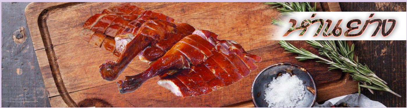
ห่านย่าง

เที่ยง รับประทานอาหารกลางวัน ณ กัดตาดาร ***เมนูท่านอย่างฮ่องกงแสนอร่อย***