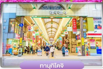
ทานุกิโคจิ