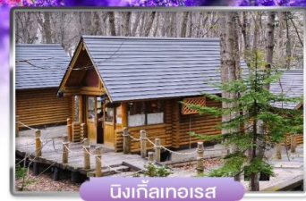
นิงเกิ้ลเทอเรซ