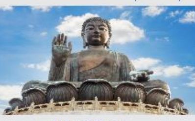
วัดใหญ่โปะหลิน