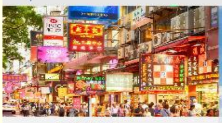
ย่านจิมซาจุ่ย