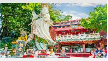
ริฟลิสเบย์

*ทางบริษัทฯ ขอสงวนสิทธิ์ในการสลับโปรแกรมทัวร์ตามความเหมาะสมขึ้นอยู่กับสถานการณ์ประจำวัน โดยคำป้ดงคังผลประโยชน์ของลูกค้เป็นสำคัญ