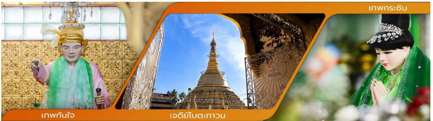
เทพทันใจ

คำบูชาเทพทันใจ เอหิ สักกะ มหานัทโปิระโปิระจีโปตะถองสิทธิมัตถุ อิหังพะลัง เอตัสสะมิงรัตตะนัง พุทธัง อัมมัง สังฆัง เทวานัง ประสิทธิลาภ ชยโยนิจัจจ วันทามิสัพพะทา สวาโหม