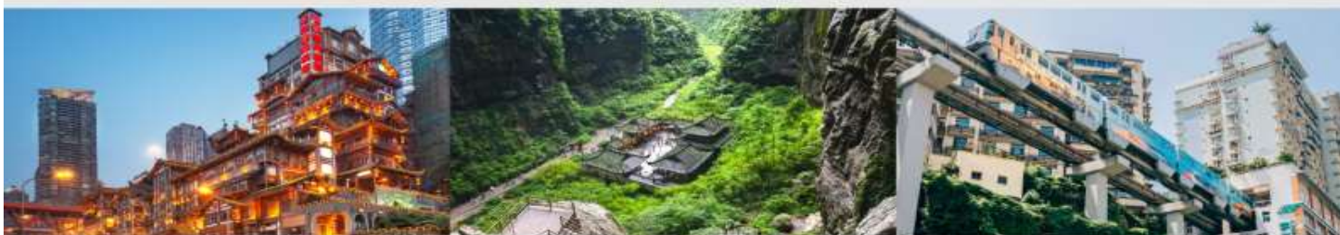
หงหยาดัง