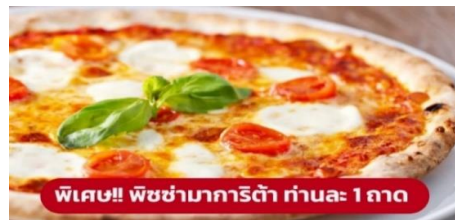
พิเศษ!! พิซซ่ามาการิตต้า ท่านละ 1 ถาด

นำท่านเก็บภาพความประทับใจและถ่ายรูป 1 ใน 7 สิ่งมหัศจรรย์ของโลก หอเอนปิซ่า (Leaning Tower of Pisa) หอเอนปิซ่าที่สร้างขึ้นเพื่อเป็นหอรระฆังแห่งวิหารประจำเมือง แต่เพียงการเริ่มต้นของการสร้างถึงบริเวณชั้น 3 ก็เกิดการทรุดตัวและต้องหยุดการก่อสร้างจนถัดมาอีก 100 ปี ถึงได้สร้างต่อจนเสร็จสมบูรณ์ มหาวิหารปิซ่า (Cathedral of Pisa) มหาวิหารที่สวยงามที่สุดในลักษณะโรมันเนสส์ แสดงให้เห็นจากชายหอคีลุ่ม กลางตัวมหาวิหาร และขวาหอรระฆัง ตัวมหาวิหารเป็นผังกางเขน มีมุขท้ายวัดและตกแต่งซุ้มโค้งรอบวัดภายนอกเป็นแบบแถบหินอ่อน สลับสีทางขวาง ซึ่งกลายมาเป็นแบบที่เรียกว่า "ลักษณะปิซ่า" และโดมรูปไข่และ Pisa Baptisty of St. John เป็นอาคารทางศาสนาคริสต์นิกายโรมันคาทอลิก จากนั้นนำท่านเดินทางสู่ เมืองมิลาน (Milan) (ระยะทาง 282 ก.ม. / 4 ชั่วโมง)