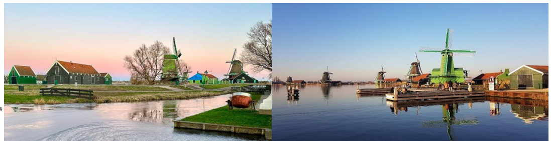
ยุโรปหัตถกรรม 4

** ชำระค่าทัวร์ในนามบริษัท ไลออน ทราเวล จำกัด เท่านั้น **