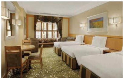
ภาพจากโรงแรมมักกะห์ มิลลันเนียม