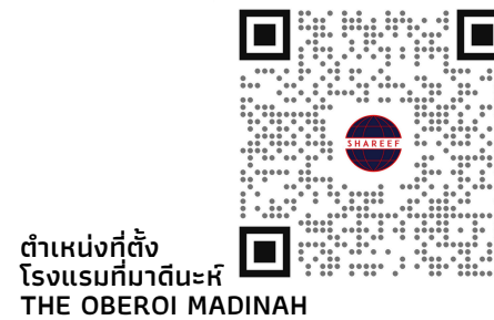
ตำแหน่งที่ตั้ง โรงแรมที่มาดีนะห์ THE OBEROI MADINAH