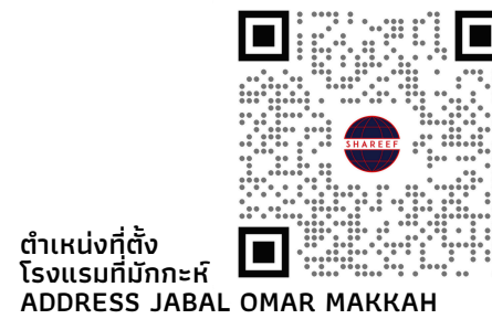
ตำแหน่งที่ตั้ง โรงแรมที่มักกะห์ ADDRESS JABAL OMAR MAKKAH

มาดีนะห์ : THE OBEROI MADINAH HOTEL 5 ดาว อาหารบุฟเฟ่ต์วันละ 3 มื้อ