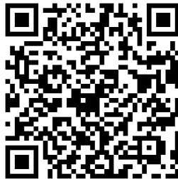
Qr Code Line ID

เลขที่ 78 ชั้น 2 อาคารมุกดา ถนนสาทรเหนือ แขวงสีลม เขตบางรัก กทม. 10500