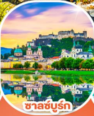
ซาลซ์บูร์ก