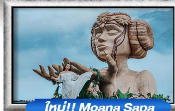
ใหม่!! Moana Sapa