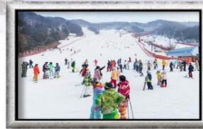
ลานสกีขนาดใหญ่