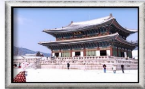
พระราชวังเคียงบกกุง

พิเศษ!! ซิมการ์ดอ่าวเบอร์รี่สดๆ จากไร่ BBQ ปิ้งย่างเกาหลี