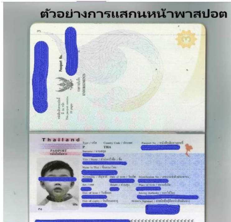
รูปตัวอย่าง ต้องพื้นหลังสีขาวเท่านั้น