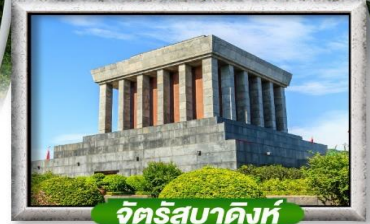
จัตุรัสบาติงห์