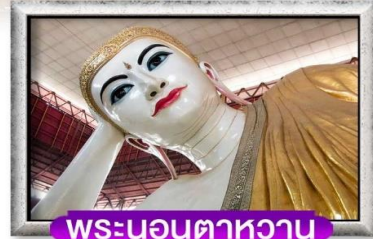
พระนอนตาหวาน

พิเศษสุด!! เมฆกุ้งแม่น้ำเผา + ฟรุ๊ตชาเข้าประเทศพม่า