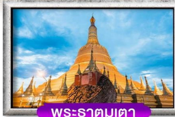
พระธาตุมูเตตา