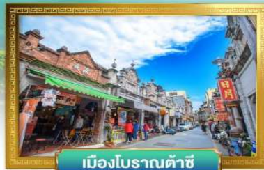
เมืองโบราณต้าซี

✓ อิสระช้อปปิ้งถนนฝรั่งเศสเจีย และตลาดร้อยปี