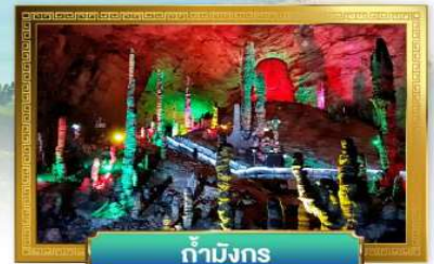
ถ้ำมิงกร