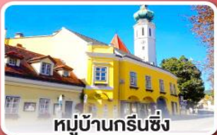
หมู่บ้านกรีนซิง