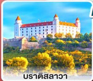
ปราติสลาวา

เยือนหมู่บ้านกรีนซิง แห่งออสเตรีย พร้อมอาหารค่ำแบบ “ฮอยริเก้”และไวน์สด