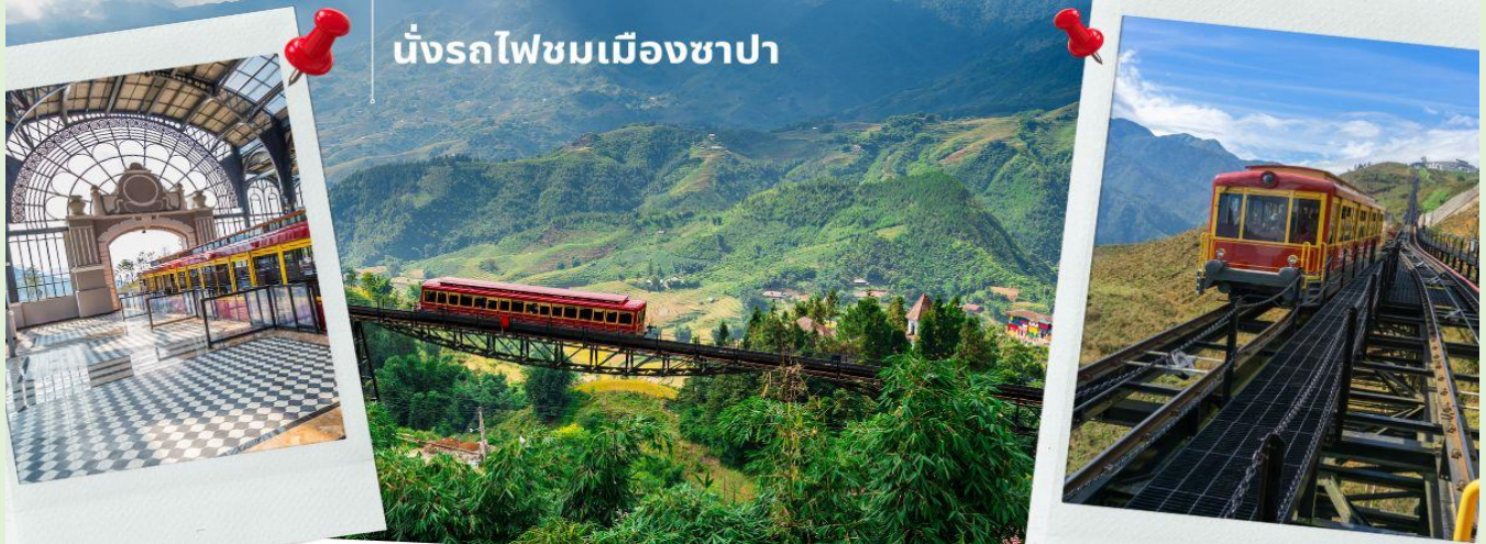
นังรถไฟชมเมืองซาปา

นำท่าน นังรถไฟชมเมืองซาปา (รวมค่ารถไฟชมเมือง) ท่านจะได้พบกับวิวทิวทัศน์ของเมืองซาปาที่เต็มไปด้วยความสดชื่น และสุดกลิ่นอายธรรมชาติ และยังตื่นตาไปด้วยวิวภูเขา และนาขั้นบันได ที่มีชื่อเสียงของเมืองซาปาอีกด้วย ความยาวประมาณ 2 กิโลเมตร โดยใช้เวลาประมาณ 20 นาทีเพื่อไปสู่สถานีขึ้นกระเช้าที่จะนำท่านขึ้นสู่ยอดเขาฟานซีปัน