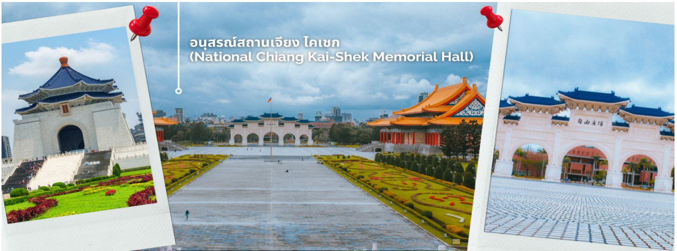
อนุสรณ์สถานเจียง ไคเชก (National Chiang Kai-Shek Memorial Hall)

CVZT4 ไต้หวัน บัน Rail Bike ปล่องโยม ทะเลสาบสุริยันจันทรา 4 วัน 3 คืน VZ (MAY-OCT24)