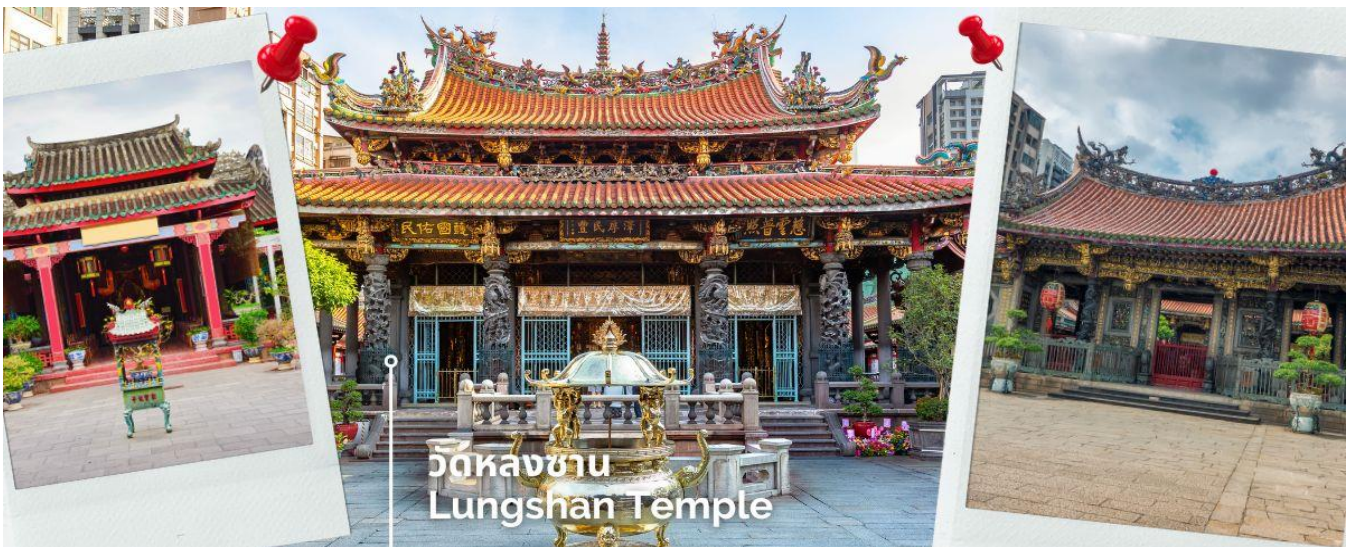
วัดหลงซาน Lungshan Temple

นำท่านสักการะ วัดหลงซาน เป็นหนึ่งในวัดที่เก่าแก่และมีชื่อเสียงมากที่สุดแห่งหนึ่งของเมืองไทเป ตั้งอยู่ในแถบย่านเมืองเก่า มีอายุเกือบ 300 ปี สร้างขึ้นโดยคนจีนชาวฝูเจี้ยนช่วงปีค.ศ. 1738 เพื่อเป็นสถานที่สักการะบูชาสิ่งศักดิ์สิทธิ์ตามความเชื่อของชาวจีน มีรูปแบบทางด้านสถาปัตยกรรมคล้ายกับวัดพุทธของจีน แต่มีลูกผสมของความเป็นไต้หวันเข้าไปด้วย ทำให้ที่นี่เป็นอีกหนึ่งแหล่งท่องเที่ยวที่ไม่ควรพลาด และภายในก็ยังมีเทพเจ้าองค์อื่นๆตามความเชื่อของชาวจีนอีกมากกว่า 100 องค์ด้านในมาจากทั้งศาสนาพุทธ เต๋า และขงจื้อ เช่น เจ้าแม่ทับทิม ที่เกี่ยวข้องกับการเดินทาง, เทพเจ้ากวนอู เรื่องความซื่อสัตย์และหน้าที่การงาน และเทพเย่วเหล่า หรือ ผู้เฒ่าจันทรา ที่เชื่อกันว่าเป็นเทพผู้ผูกต้ายแดงให้สมหวังด้านความรัก