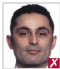
ไกลเกินไป