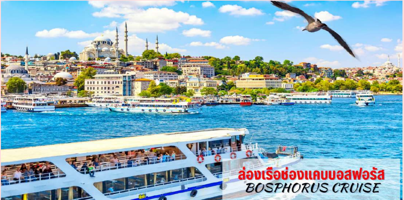
ล่องเรือช่องแคบบอสฟอรัส BOSPHORUS CRUISE

นำท่าน ล่องเรือชมช่องแคบบอสฟอรัส (Bosphorus Cruise) ช่องแคบที่เชื่อมต่อทะเลดำ (The Black Sea) ทะเลมาร์มา (Sea Of Marmara) มีความยาวประมาณ 32 กม. ความกว้างตั้งแต่ 500 เมตรจนถึง 3 กิโลเมตร ซึ่งถือว่าเป็นที่สุดของยุโรปและเอเชียมาพบกันที่นี่นอกจากความสวยงามแล้ว ช่องแคบบอสฟอรัสยังเป็นจุดยุทธศาสตร์ที่สำคัญยิ่งในการป้องกันประเทศตุรเคียอีกด้วย ขณะล่องเรือท่านจะได้เพลิดเพลินกับการชมทิวทัศน์ที่สวยงามทั้งสองข้างทางไม่ว่าจะเป็นพระราชวังโดลมาบาห์เซ่หรือบ้านเรือนสไตล์ยุโรปของบรรดาเศรษฐีตุรเคียและมีป้อมปืนตั้งเรียงราย