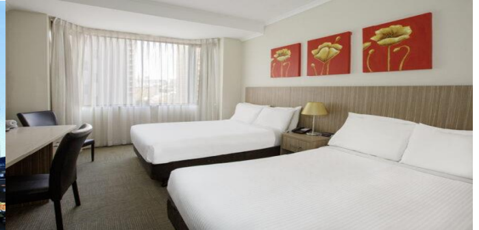
(โรงแรมย่านกลางเมือง ใกล้แหล่งช้อปปิ้ง เดิมทางสะดวก) *รูปภาพเพื่อการโฆษณา*

วันที่สอง (วันที่ 28 ธ.ค.67) นครซิดนีย์ – อุทยานแห่งชาติบลูเมาท์เทนส์ – สวนสัตว์พื้นเมือง FEATHERDALE