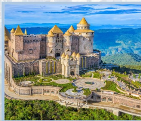
ปราสาทจันตรา