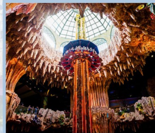
สวนสนุก Fantasy Park