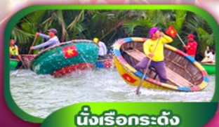
นั่งเรือกระดิง