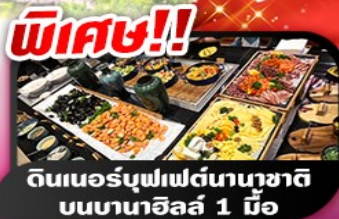
พิเศษ!! ดินเนอร์บุฟเฟ่ต์นานาชาติ บนบานาฮิลล์ 1 มื้อ