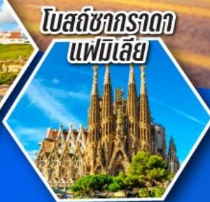
โบสถ์ซากราดา แฟมิลีย