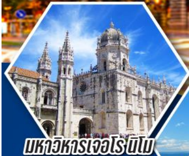
มหาวิหารเจอโรนิโม