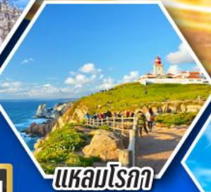
แควมโรกา