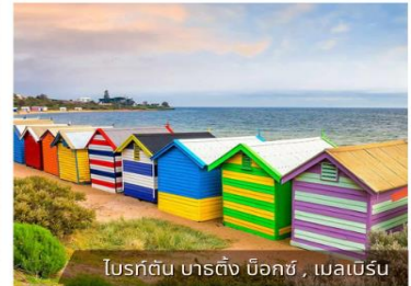
โบสถ์ต้น นารติง บ็อคซ์, เมลเบิร์น