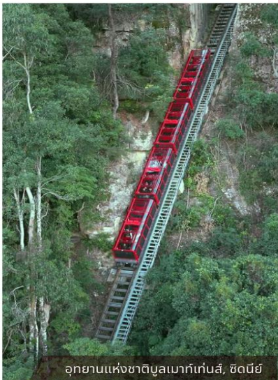
อุทยานแห่งชาติบลูเมาท์เทนส์, ซิดนีย์