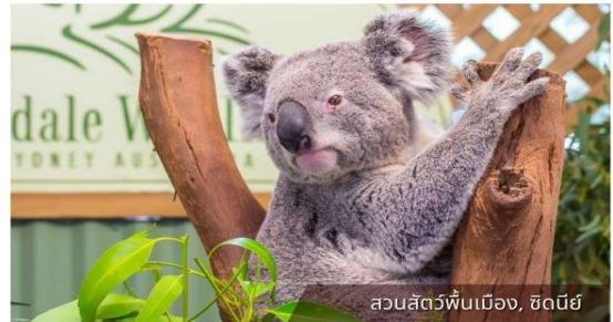
สวนสัตว์พื้นเมือง, ซิดนีย์