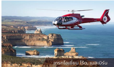
เครกโฮเชียน ไรด์, เมลเบิร์น