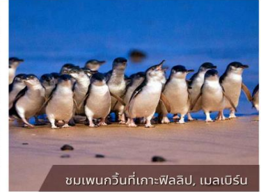
ชมเพนกวินที่เกาะฟิลลิป, เมลเบิร์น