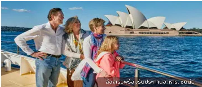
ล่องเรือพร้อมรับประทานอาหาร, ซิดนีย์