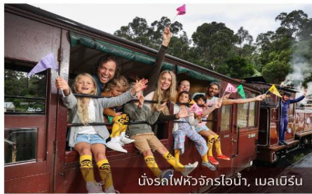
นั่งรถไฟหัวจักรไอน้ำ, เมลเบิร์น