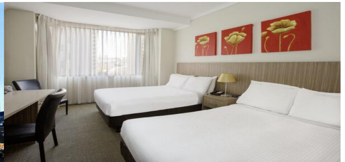
(โรงแรมย่านใจกลางเมือง ใกล้แหล่งช้อปปิ้ง เดินทางสะดวก)