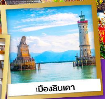
เมืองลินเดา