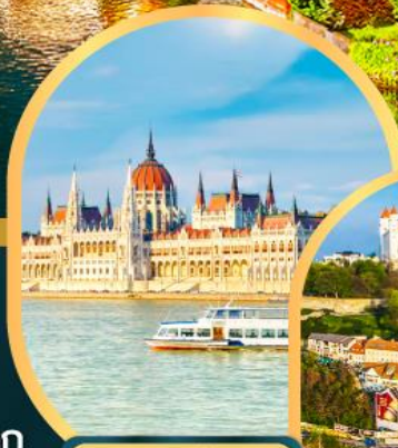
ล่องเรือแม่น้ำดานูบ